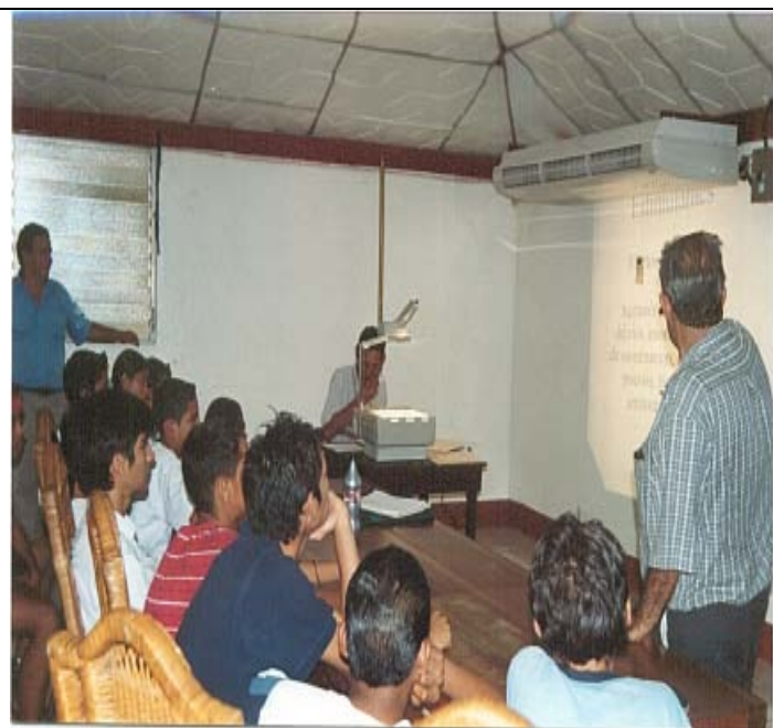
CAPACITACION DE DOPAJE