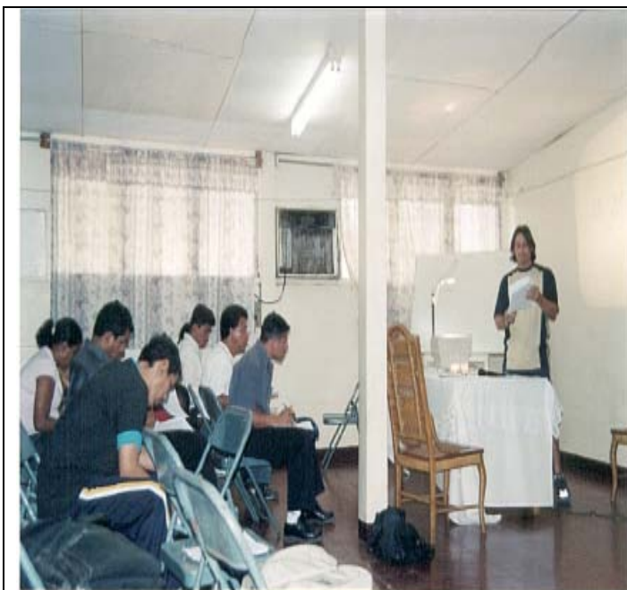
CAPACITACION DE PATINAJE