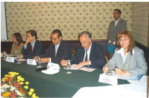
Taller de arranque del Programa de Seguridad Ciudadana realizado los días 06 y 07 de Septiembre de 2005.