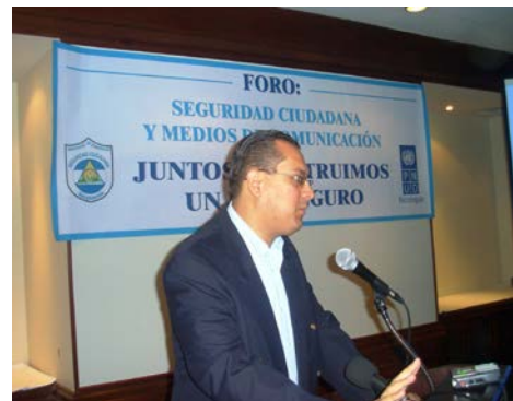
Palabras de inauguración del Ministro de Gobernación en el Primer foro con los medios de comunicación