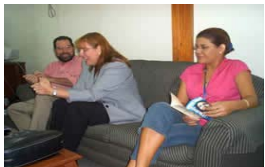
Vice Ministra de Gobernación en reunión con Junta Directiva de Medios escritos.