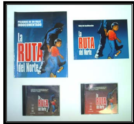
Guía de facilitación para los maestros, cuadernillo y medios de audio de testimonios y dramatizaciones de casos de trata de personas

b. Se logró incluir del tema de Trata y Tráfico en el programa educación para la vida en las actividades de educación itinerante en los once municipios priorizados por el BID en el proyecto seguridad ciudadana.