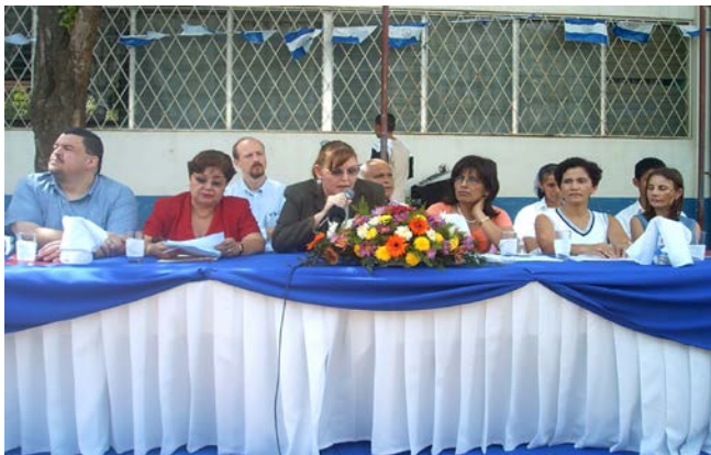
Lanzamiento del Manual de Prevención contra la Trata de Personas en el Instituto Benjamín Zeledón

19. Se logró hacer un acuerdo con la Organización Internacional para las migraciones en la ejecución del Proyecto de Atención, Repatriación, Reinserción y Escolar; con dicho proyecto piloto se dará atención y seguimiento aproximadamente de 5 a 7 casos en riesgos de trata de personas, asimismo se dará apoyo en la campaña de prevención y sensibilización a la población, en especial al sector mas vulnerable.