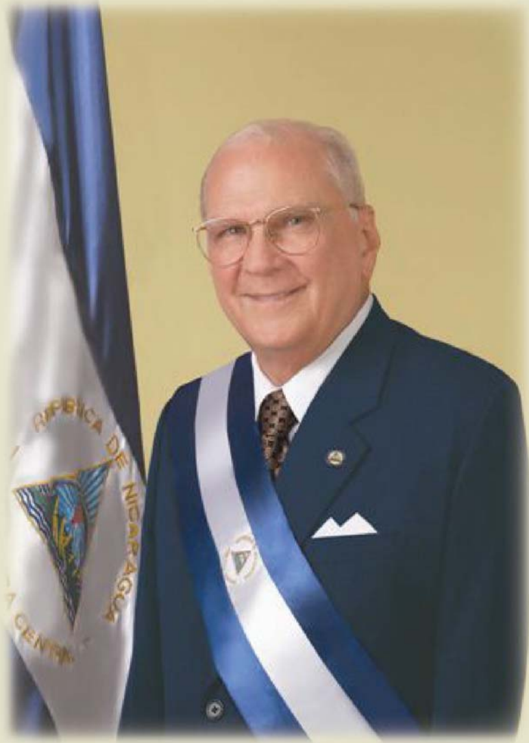
Presidente de la República de Nicaragua Ing. Enrique Bolaños Geyer