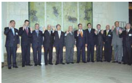
Los Mandatarios del SICA junto al Presidente Chen Shui-bian durante la V Cumbre República de China (Taiwán)-Centroamérica y República Dominicana (Managua, 26 de septiembre de 2005)