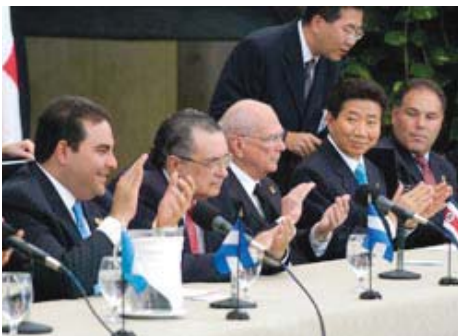
En la foto el Presidente Enrique Bolaños Geyer, durante la II Cumbre de Jefes de Estado y de Gobierno de los Países del Sistema de la Integración Centroamericana (SICA), con el Presidente de Corea Señor Rob Moo-hyun. (San José, Costa Rica, 11 de septiembre del 2005)