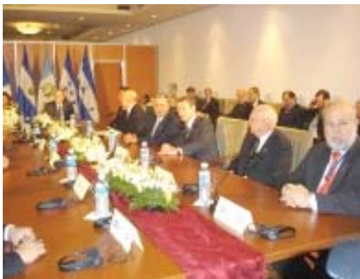
Reunión de Jefes de Estado y de Gobierno del SICA, con el Presidente George Bush de los Estados Unidos de Norteamérica en ocasión de la IV Cumbre de las Américas (Mar del Plata, Argentina, 4 de noviembre de 2005)