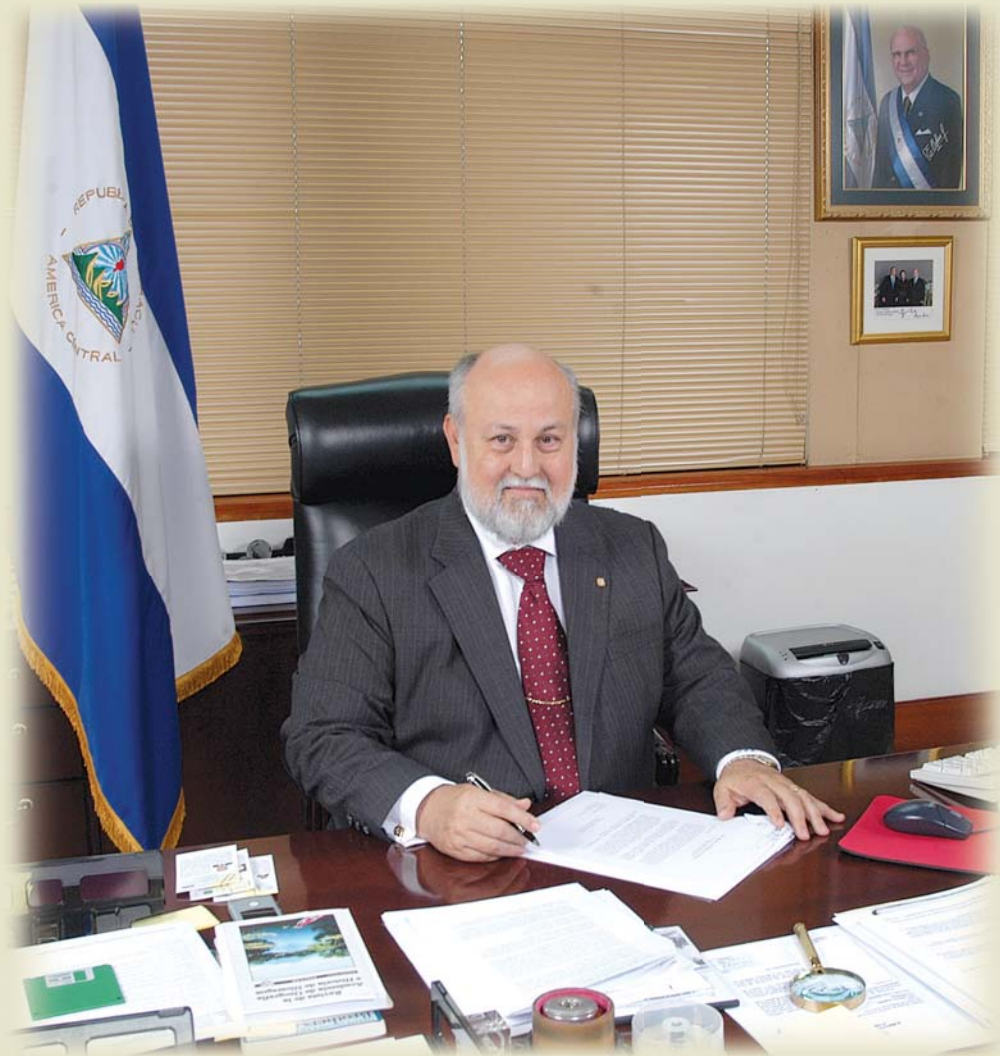
Ministro de Relaciones Exteriores Lic. Norman Caldera Cardenal