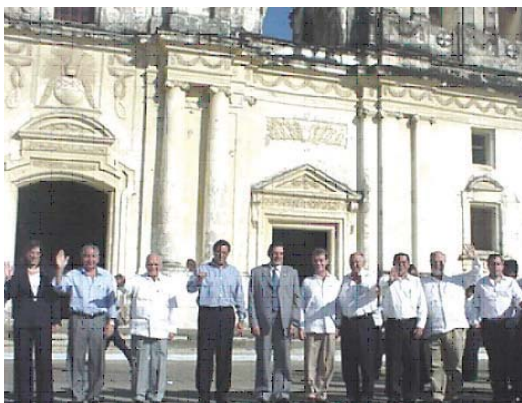
Mandatarios del SICA frente a la Catedral de León en ocasión de la XXVII Reunión Ordinaria del SICA (León, Nicaragua, 2 de diciembre de 2005)