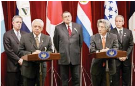
El entonces Vicepresidente José Rizo Castellón junto al mandatario japonés, Sr. Junichiro Koizumi durante la Segunda Cumbre Japón-Centroamérica (Tokio, Japón, 18 de agosto de 2005)