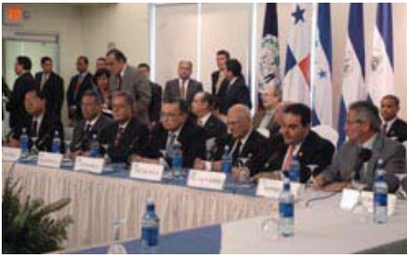
Los Mandatarios centroamericanos durante una conferencia de prensa en ocasión de la Reunión Extraordinaria de Jefes de Estado y de Gobierno del SICA (Aeropuerto Internacional de Managua, 5 de septiembre de 2005)