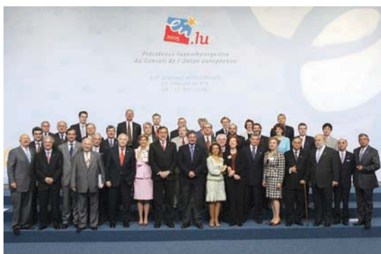
XII Reunión Ministerial, UE – Grupo de Río, a la cual asistió el Canciller de la República, Licenciado Norman Caldera Cardenal, Luxemburgo, 26-27 mayo del 2005,

El 27 de mayo del 2005, en Luxemburgo, se llevó a cabo la XII Reunión Ministerial del Grupo de Río- Unión Europea, a la misma asistió una Delegación Oficial encabezada por el Lic. Norman Caldera Cardenal, Canciller de la República.