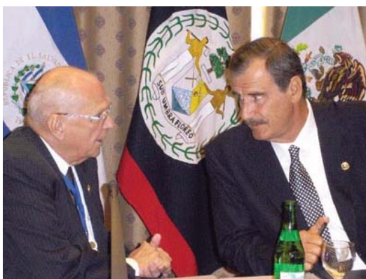
El Presidente de Nicaragua, Ing. Enrique Bolaños Geyer y Presidente Vicente Fox de México durante la Reunión de Jefes de Estado y de Gobierno del SICA y México en el marco de la IV Cumbre de las Américas (Mar del Plata, Argentina, 4 de noviembre de 2005)