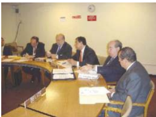
En el centro, el Canciller Norman Caldera Cardenal en su calidad de Presidente Pro Tempore del Consejo de Ministros de Relaciones Exteriores del SICA, durante un encuentro de los Cancilleres del SICA, realizado en New York, para abordar aspectos sobre la Reunión Extraordinaria de Jefes de Estado y de Gobierno de los Países Miembros del Sistema de la Integración Centroamericana a realizarse en Managua el próximo 27 de septiembre. (19-09-2005)