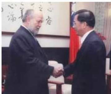
El Canciller de la República de Nicaragua, Lic. Norman Caldera Cardenal, con el Señor Chen Shui-bian, Presidente de la República de China (Taiwán).

Ministro de Relaciones Exteriores con quien abordó temas de especial interés para Nicaragua como lo relacionado a la deuda. El Ministro Chen expresó la voluntad de su nación de hacer una revisión al respecto. El Canciller Caldera realizó asimismo una visita de cortesía al Excelentísimo Señor Chen Shui-bian, Presidente de la República de China (Taiwán).