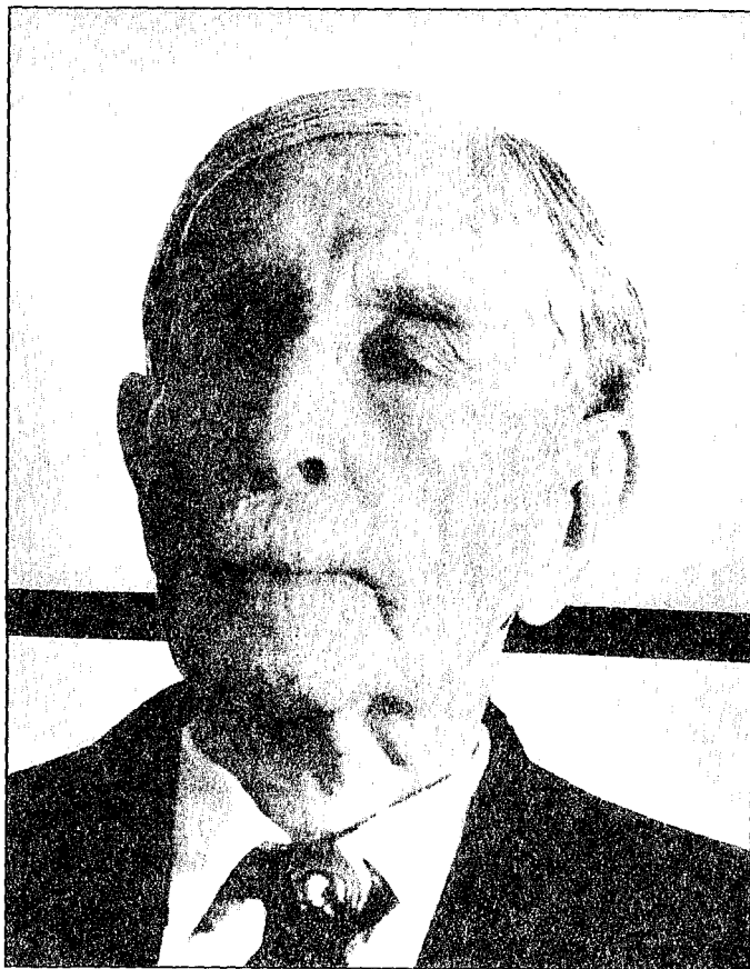
Rafael Arévalo Martínez en sus últimos años