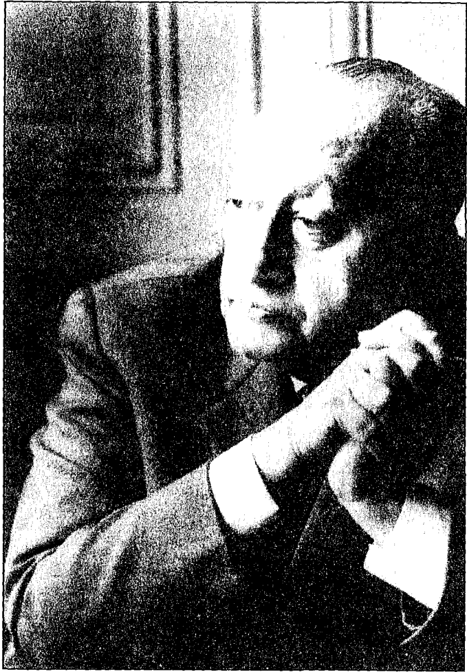
Miguel Ángel Asturias